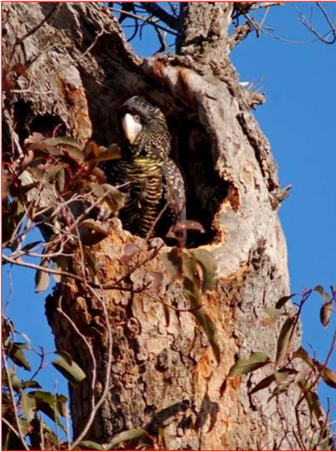
Femelle Cacatoès noir des forêts à queue rouges dans le nid.