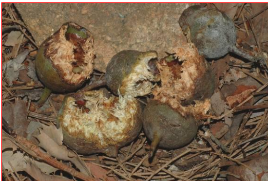
Les noix de Marri grignotés par les cacatoès noirs à queue rouge.